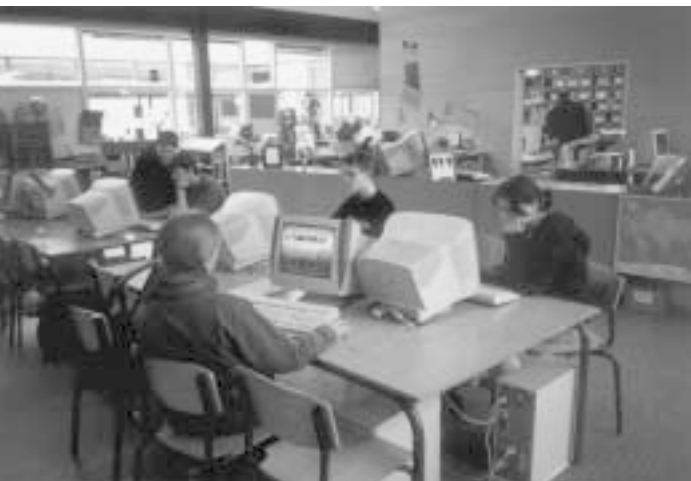
Elevarbejdspladser med et kig ind i skolebibliotekskontoret

arbejdet på skolebiblioteket, fordi fleksibilitet er et nøgleord. Meget af det, vi gør i skolebiblioteket er for 5-10-20 % af eleverne, mens andre ting er for andre procenter.”