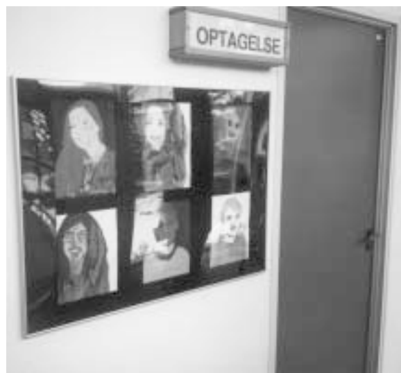
Et af studierne