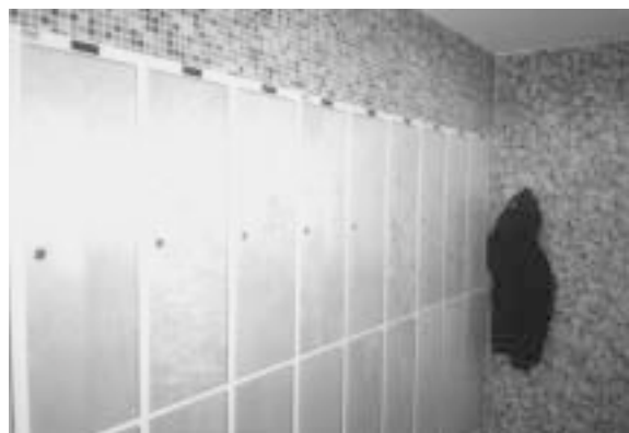
Elevskabe i de nye hjemmeområder

"Vi har en dygtig mand til lyd (ressourceperson, fruygteligt ord!), men vi er nødt til at inddrage flere i