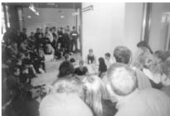
"Stomp" omkring det runde bord

skolebiblioteket tager imod brugeren/gæsten på en indbydende og åben måde. Se tegning + fotos!