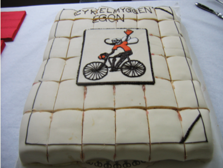
Lagkage, Forfatterskolen for Børnelitteratur 10 år, 10.9.2009

samlede indtægter ved kurser, seminarer og eksternt finansieret forskning og kr. 395.000 som indtægter ved undervisning på DPU's uddannelser. Til dækning af de resterende udgifter, kr. 1.806.000 budgetteredes med midler fra dekanens pulje.