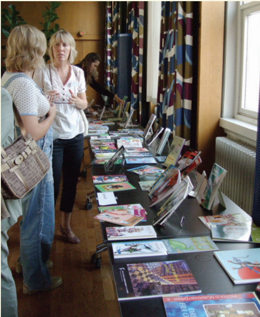
Bogudstilling, Forfatterskolen for Børnelitteratur 10 år, 10.9.2009

efterfølgende en af elevernes billedbogstekster til udgivelse i 2010. Fra september var der fokus på romanen som genre, konkret belyst gennem brevroman, fantasy, krimi og den historiske roman, hvorefter eleverne selv gik i gang med at skrive en roman.