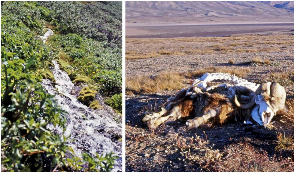
Figur 7.2 Arktiske landskaber

Kun i Lavarktis ser man krat, og grænsen mellem Højarktisk og Lavarktis har generelt stor betydning for biodiversiteten - dvs. antal og forskellighed af arter.