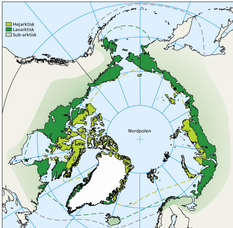
Figur 7.1 Arktis De arktiske zoner, som de er defineret af CAFF (Conservation of Arctic Flora and Fauna).

Med et varmere klima bliver udbredelsen af det højarktiske område mindre og mindre, og det truer de arter, som kun findes der.