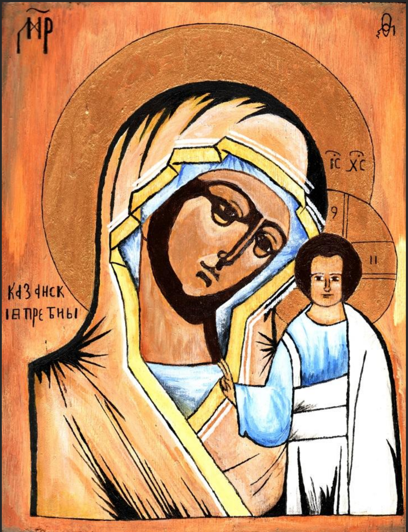
Ikön, akrylmaling, bladguld og sort tusch på træ, af elev på bk-b niveau 2010.