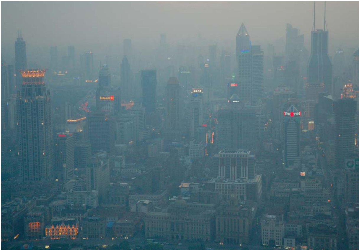
Shanghai (Puxi).

drivhusgasser og mere solvarme. Men det er ikke kun den moderne, vestlige byform, som belaster miljøet. Det er også de urbane, vestlige livstile, som f.eks. det at vi spiser mere kød, hvilket nødvendiggør større landbrugsarealer og forårsager mere udledning af drivhusgasserne metan ( \text{CH}_4 ) og lattergas ( \text{N}_2\text{O} ).