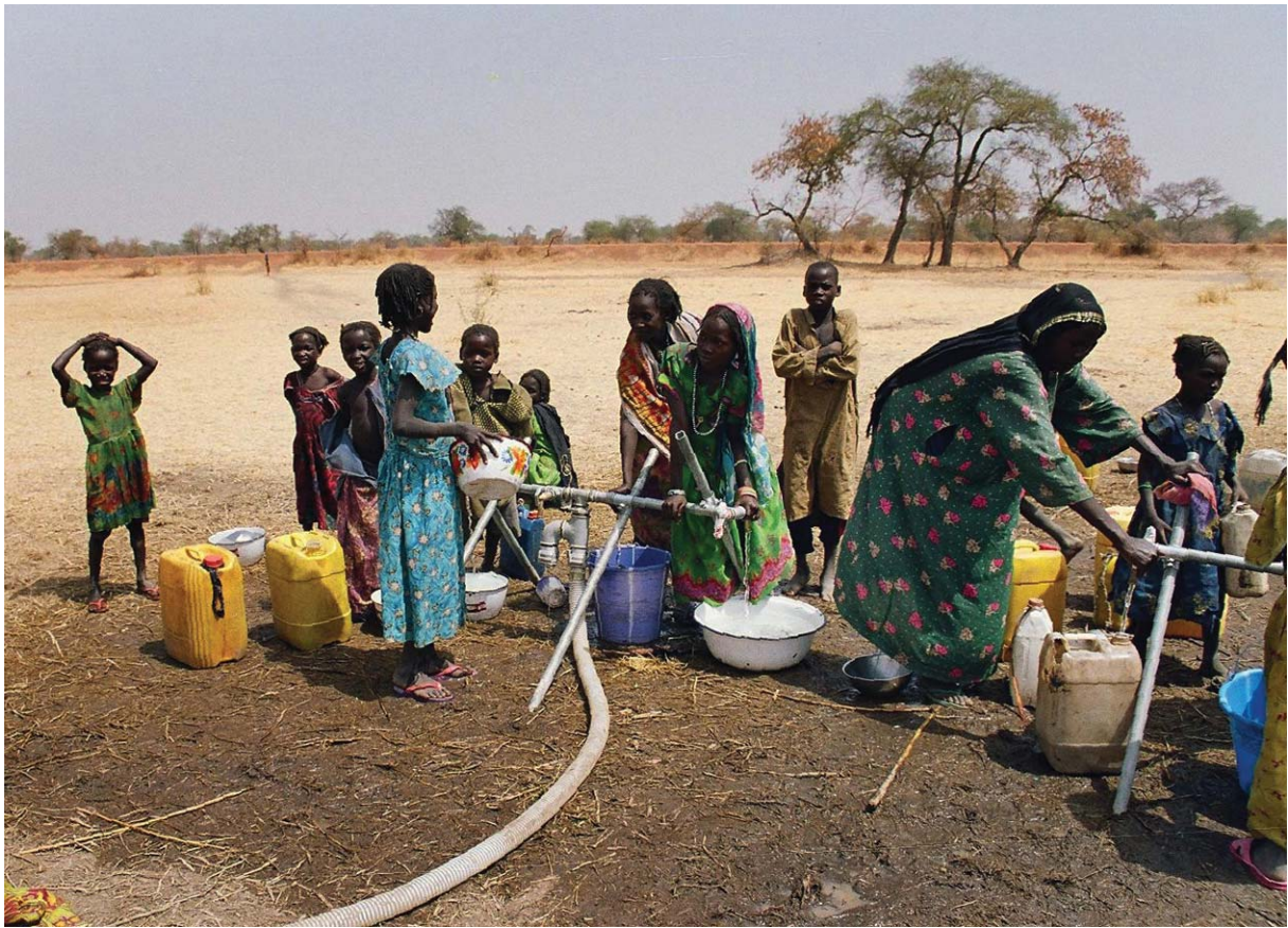
Vandforsyning til flygtninge i Salamat, Chad.

områder i den fattige del af verden, end ikke adgang til elektricitet.