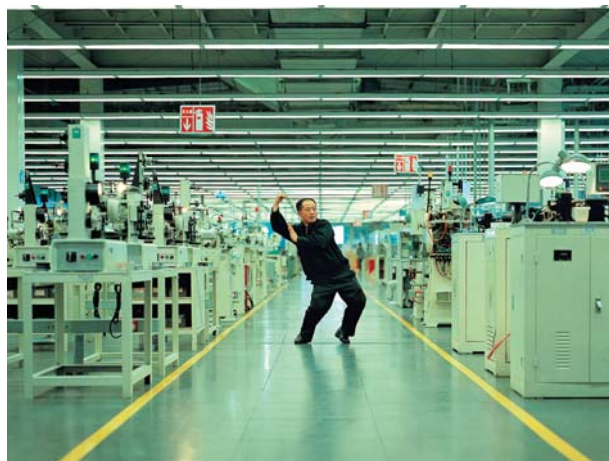
Cao Fei "Whose Utopia" (2006)

Tilmelding på www.louisiana.dk - senest fredag 6. november 2009