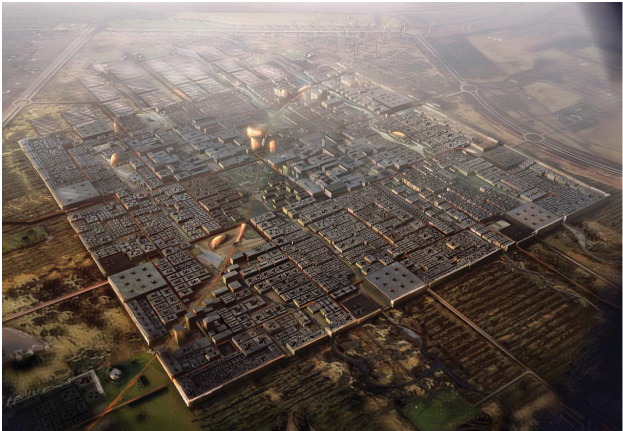
3D visualisering af Masdar. Projektet er udarbejdet af Foster + Partners. © Abu Dhabi Future Energy Company

Det ville nok være smartere at kopiere naturen – også i den vestlige verden!