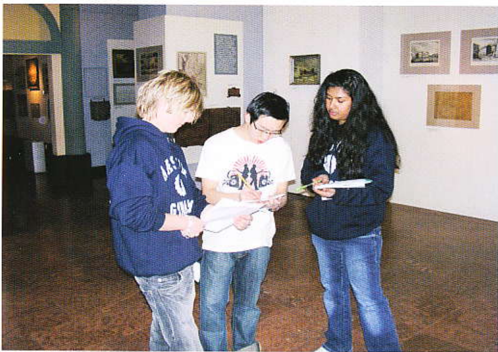
Elever løser opgaver på Budapest historiske museum

Dette museum og dets forholdsvist moderne udstillingsform er et must, hvis man vil arbejde med Budapest byudvikling og bygeografi. Der findes plancher på engelsk, og eleverne kan sagtens få et godt udbytte af besøget.