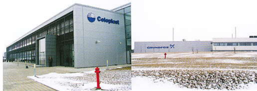
Virksomhederne Coloplast og Grundfos i Tatabanya industridistrikt.