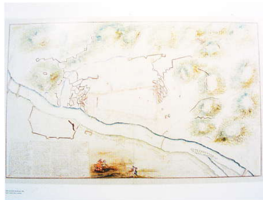
Det befæstede Budapest efter tyrkernes fordrivelse i 1686.