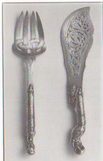
Sølvbestik med karakteristisk »vikingeslyng«. (1862).

Vedlagt er to eksempler på vikingen som modebegreb. Det ene forestiller et sæt bestik fra 1862, designet med de karakteristiske 'slyng' der danner baggrund for mange af vikingetidens udsmykninger. Den anden er den samme slags slyng, fra en 2001 udgave af National Geographic, denne gang i form af en tatovering. Hvor tatoveringen og den tilhørende udtalelse i dag karakteriserer vikingen som et barskt folkeeje, var bestikket et udtryk for et mere generelt modefænomen fra slutningen af det 19 århundrede.