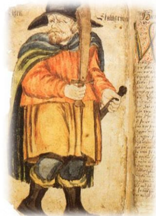
Figur 1 Vikingen i 1600-tallet

Men går vi tilbage til en afbilledning af Egil Skallagrimsson (Figur 1) tegnet i 1600-tallet 4 , får vi et helt andet billede af vikingens udseende end det der i dag møder os på TV. I denne forbindelse må man også spørge sig selv: Hvad er brug og misbrug? Der er gennem historien mange eksempler på brug, hvor vikingen bliver tilknyttet organisationer, eller privatpersoner der levede længe efter, at kong Harald kristnede danerne. I de fleste tilfælde har sammenligningen måske