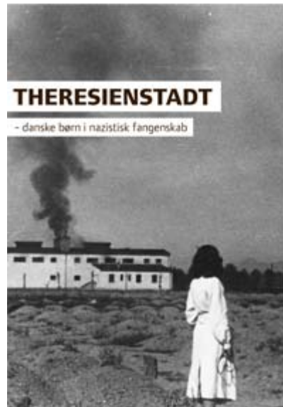
Forsidecoveret til den nye dokumentarfilm "THERESIENSTADT - danske børn i nazistisk fangenskab"