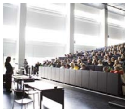
Medarbejder fra DIIS, Holocaust og folke drab byder gymnasieelever velkommen til Auschwitz-dagen

Se forslag til materiale om temaet "Kampen om erindringen"