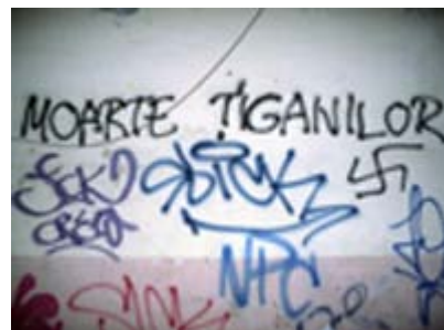
"Drøb sigøjnerne" og et hagekors er malet på en mur i Rumæniens hovedstad, Bukarest.