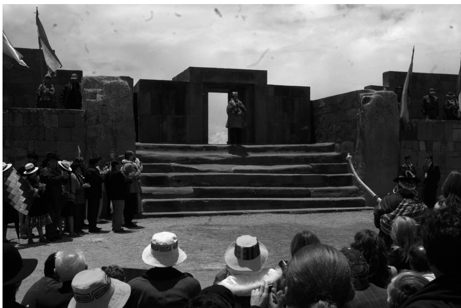
Evo Morales holder en sybolsk ceremoni på ruinerne af det hellige Tiwanaku, der er af stor symbolsk betydning for de oprindelige folk i Bolivia, dagen for sin indsættelse.