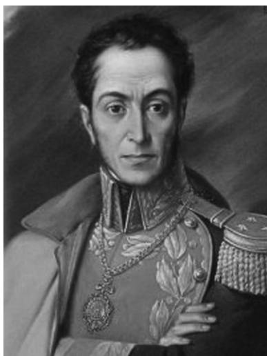
Simón Bolívar (24. juli 1783 - 17. december 1830)

Selvom Napoleon få år senere blev fordrevet og det spanske monarki genindsat, betød det ikke en tilbagevenden til spansk kolonistyre. Selvstændighedsrevolutionerne brød ud i hele Latinamerika. Vigtigt for forståelsen af den senere udvikling i Latinamerika, herunder Bolivias og for dagens forhold i Bolivia, er, at selvstændigheds-