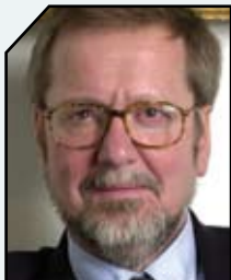
PER STIG MØLLER, DANMARKS UDENRIGS- MINISTER, I EN TALE I FOLKETINGET, 2008