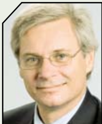
AMBASSADØR PETER TAKSØE-JENSEN CHEF FOR UDENRIGSMINISTERIETS JURIDISKE TJENESTE, 2008