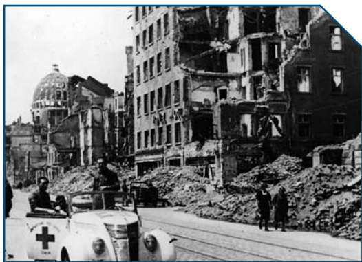
2. Verdenskrig. München i ruiner. Tyskland, 1945.

For at bekæmpe truslen fra terrorisme har nogle lande indført ny lovgivning og nye metoder blandt andet øget overvågning, brug af voldsomme forhørsmetoder, indespærring af terrormistænkte på ubestemt tid. De seneste års udvikling har mindsket nogle landes vilje til at overholde krigens regler, både fordi landene føler sig presset i forhold til nye trusler, og fordi de ikke-statslige aktører typisk ikke overholder krigens regler – blandt andet ved at bruge selvmordsbombere blandt civile. Denne udvikling betyder, at nogle stiller spørgsmålstegn ved, om krigens regler er tidssvarende og tilstrækkelige. Se synspunkter s. 22. ●