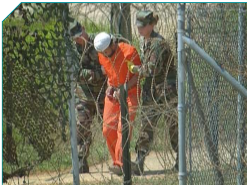
En fange eskorteres til afhøring i Camp X-Ray, Guantanamo, februar 2002.