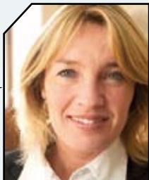
JUSTITSMINISTER LENE ESPERSEN PRESSEMEDDELELSE, 1. MARTS 2006