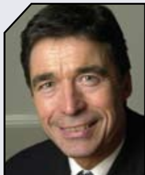
ANDERS FOGH RASMUSSEN DANMARKS STATS MINISTER, 2003