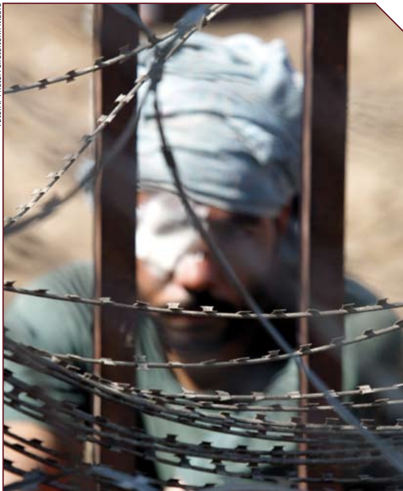
En irakisk fange i Abu Ghraib-fængslet, Irak, juni 2004.