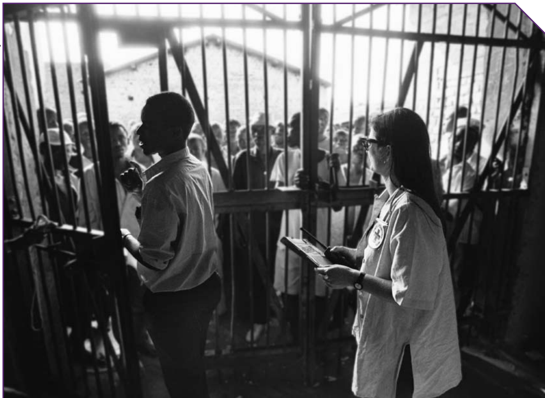
ICRC-delegat besøjer fanger i Kigali-fængslet. Rwanda, 1994.