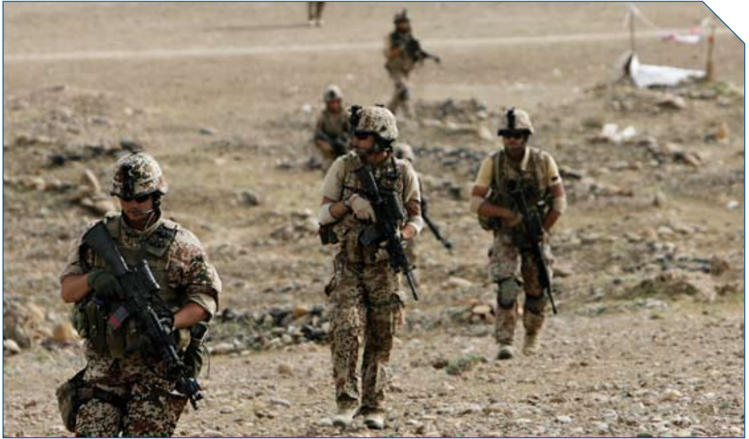
Danske soldater i Afghanistan.