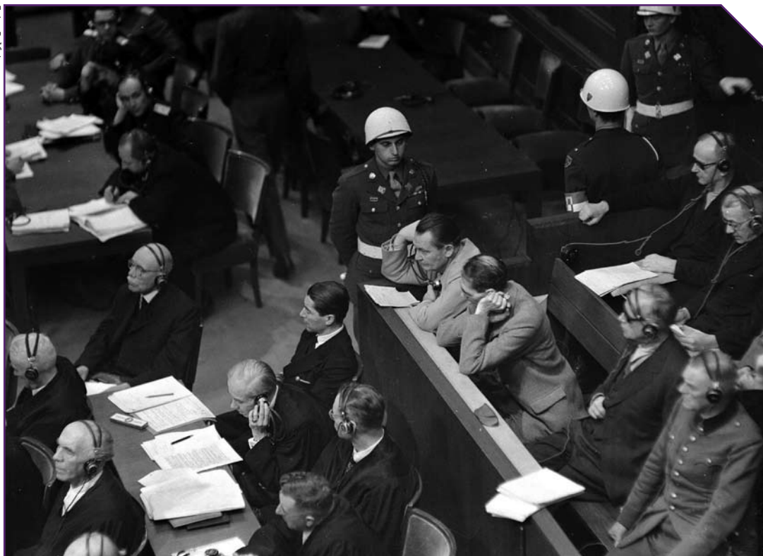
Nürnberg Tribunal. Nazi-lederne Hermann Göring (til venstre) og Rudolph Hess læner sig forover og lytter opmærksomt til anklagerne mod dem. Tyskland, 1946.