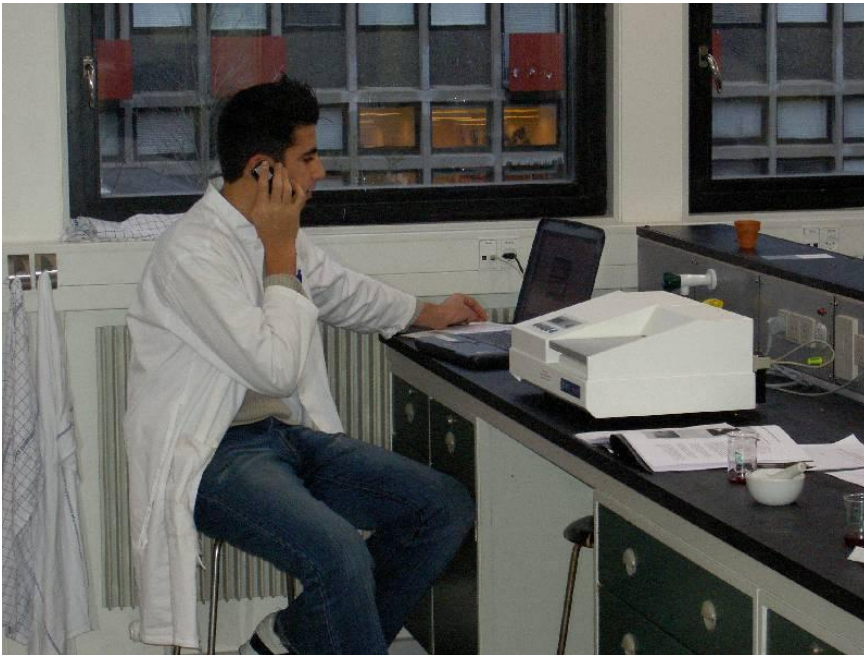
Gymnasieelev på besøg på Ungdomslaboratoriet på Københavns Universitet

På iNano er undervisningsmaterialerne tilgængelig på iNano's hjemmeside og indgår i viften af tilbud ved gymnasiebesøg på instituttet. Næsten alle de lærere der deltog i samarbejdet med iNano har haft elever på besøg på iNano .