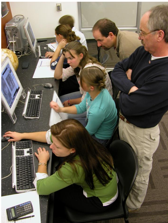
Observationer fra rummet studeres grundigt

Ved projektets afslutning er der 7 skoler,