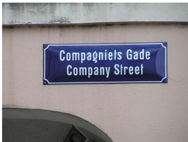
Kompagnistræde, St. Croix.

Thomas Fowell Buxton, “ A Review of The African Slave Trade ”, (Birmingham: B. Hudson, Bull Street – Reprinted from the Leeds Mercury, 1839).